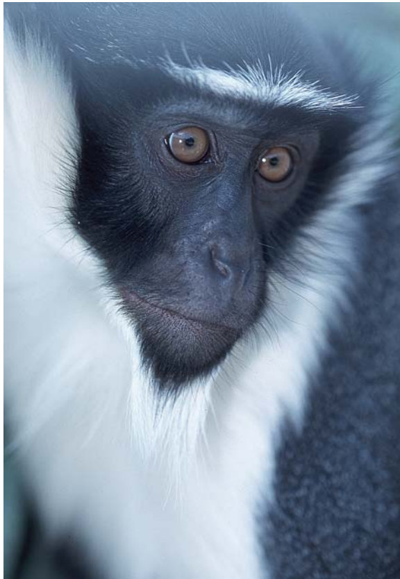
Abb. 2: Rolo-Meerkatze ( Cercopithecus diana roloway ).

ausführliche Themenbeschilderung zur Bedrohung der sanften Riesen. Neben der Lebensraumzerstörung ist die Jagd auf das Fleisch wildlebender Tiere, das sogenannte Bushmeat, mittlerweile zur größten Gefahr nicht nur für die Primaten Afrikas geworden. Mehr als 1 Million Tonnen Bushmeat gelangen jedes Jahr auf die afrikanischen Märkte (EAZA 2000). Die von der Holzindustrie tief in die Wälder geschnittenen Trassen können von den Wilderern genutzt werden und ermöglichen ihnen in nahezu alle Winkel des tropischen Regenwaldes Zentral- und Westafrikas vorzudringen. Bei der ständig wachsenden Bevölkerung besitzt das Fleisch wildlebender Tiere einen höheren Stellenwert als das von Haustieren. Das Bushmeat ist keine lebensnotwendige Proteinquelle, sondern gilt mittlerweile als Statussymbol der reichen Stadtbevölkerung. Die ursprünglich traditionelle Jagd auf das Fleisch wildlebender Tiere ist zu einem stark kommerzialisierten Bushmeat-Handel eskaliert, was in den nächsten Jahren zu einem regelrechten „Leerfangen“ der Tropischen Wälder führen wird.